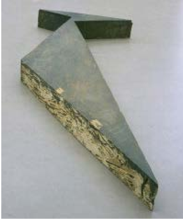
Platform Made up of the Space between Two